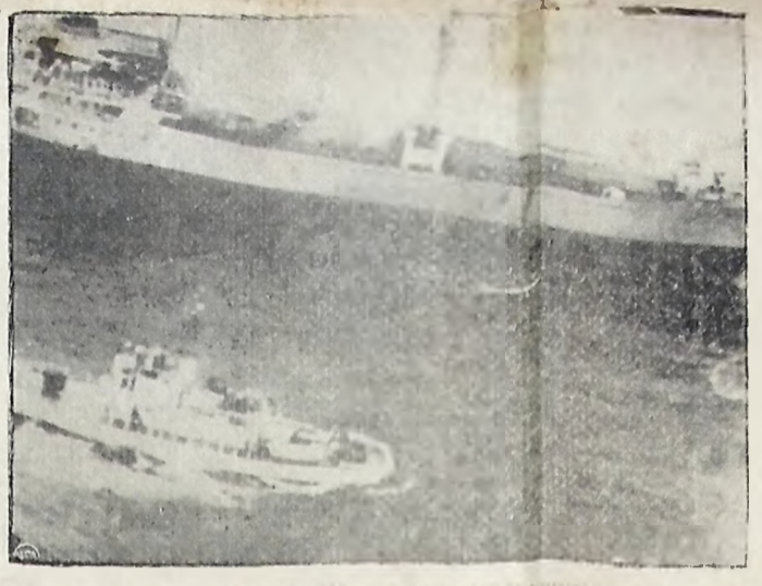
Um grupo de soldados em formação durante uma manobra no campo de treinamento de Itaciba, Espírito Santo.

Reviravolta na... Em Colômbia, p. siveleto em Paris, encerrada a sessão da Assembleia Nacional Constituinte. A Assembleia Nacional Constituinte, em sessão, em Paris, encerrada a sessão da Assembleia Nacional Constituinte.