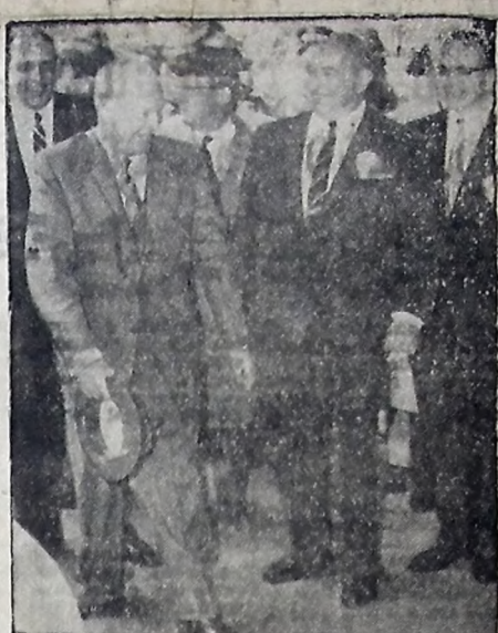
SORRINDO — O Presidente Eisenhower é todo sorrisona sua chegada a New York. O chefe do Executivo vem a esta cidade para proferir um discurso na Conferência de Melhoria Econômica...