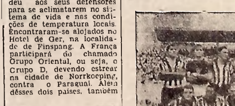
O Forte quadro do Botafogo, que defenderá domingo, no Estádio da Graça, a posição de líder insisto

concorrerão Iugoslávia e Escócia, sendo que os "luggos" são apontados favoritos dessa série. Mas os gauleses crêm na classificação. Seu preparador, Raul Nicolas mostra-se confiante e otimista, julgando que irão as quartas de final.