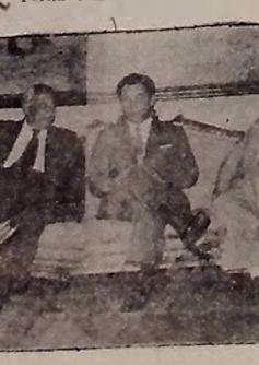
EXPOSIÇÃO DO CHEFE DO EXECUTIVO — Conforme noticiamos nesta edição, durante o deslocamento da comissão de Senadores, o governador Pedro Moreno Gondim fez uma exposição detalhada da situação da Paraíba...

SAN JUAN DE PORTO RICO, 29 (UP) — Faleceu hoje o poeta espanhol, Juan Ramon Jimenez, ganhador do primeiro Nobel de literatura.