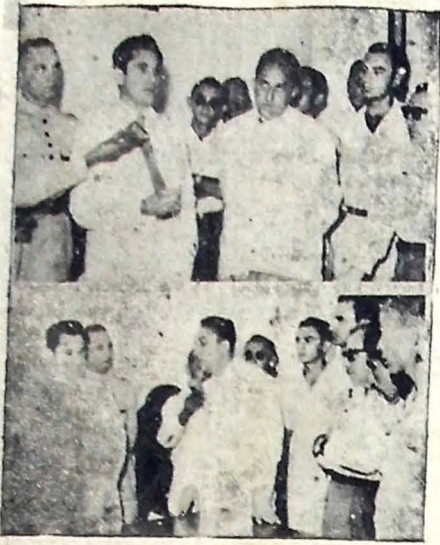
Fraquentes colírios na ocasião em que o Governador Pedro Gondim dava solução a greve, após receber os proprietários de coletivos, ontem, no Palácio do Governo. Em baixo, fala o sr. Ramon Lira, em nome dos proprietários de coletivos.