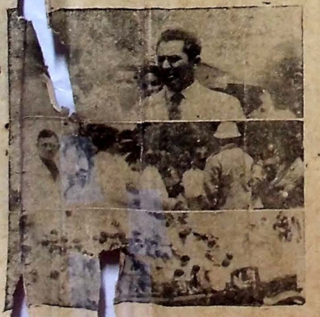
DEPUTADOS — Desfilaram, as primeiras de suas viagens, os deputados estaduais paraibanos, em um trem coletivo, para a cidade de Recife, onde se reuniram com o governador Pedro Gondim para discutir as providências para dar início ao caso. A gravura, que registra a presença do governador num dos focos da greve, apresenta de resultados obtidos após a intervenção para normalizar o tráfego. O acontecimento foi comentado durante todo o dia de ontem em detalhes na 8.ª página.