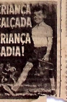
CRIANÇA CALÇADA CRIANÇA SADIÁ!

"A MINA DE PRATA" e o west "O PREÇO DA MORTE"