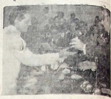
O ator Lúcio Mauro quando recebia das mãos do ministro Pascoal Carlos Magno, o "Samuel", como o melhor intérprete de 1957.