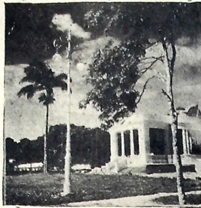
Um ângulo da Praça da Independência, tomado já agora na sua fase de restauração.