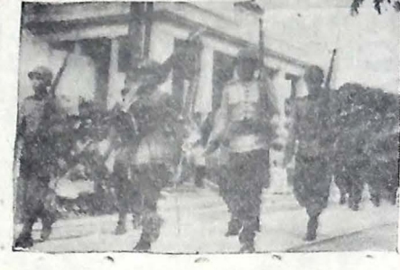
PARADA MILITAR DE 7 DE SETEMBRO — Todas as unidades militares federais aquarteladas em João Pessoa...