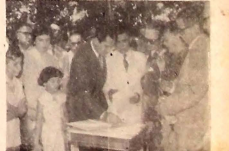
Programa organizado por ocasião das comemorações do Dia da Árvore, promovidas pela Associação Rural de João Pessoa para comemorar o Dia da Árvore.