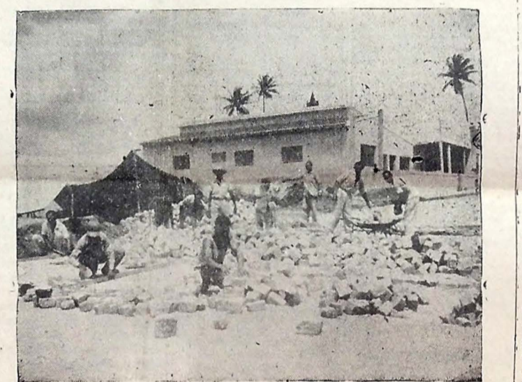
A foto documenta a conclusão dos trabalhos de calçamento da Avenida Pedro I.