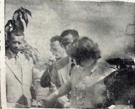
Na montagem ao alto, o Governador Pedro Gondim entrega o prêmio ao escolar que apresentou o melhor trabalho sobre a árvore. Em baixo, a srta Sylvia Gondim lança a Campanha da Horta Doméstica, plantando a primeira semente de hortaliça.