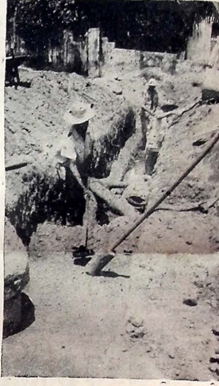
GALERIAS PLUVIAIS NA VASCO DA GAMA — Ao mesmo tempo em que realiza os trabalhos de calçamento de várias artérias da Capital, galerias pluviais são construídas nas mesmas ruas, acompanhando os trabalhos de pavimentação. Na foto, um flagrante da construção das galerias na Vasco da Gama.

APROVA O NOVO PLANO ATENAS, 23 (UPI) Soube-se que o Governo grego aprova o novo plano para Chipre, rejeitando o plano do arcebispo Makários. Não houve comentários oficiais do Governo sobre o plano de Makários mas os círculos bem informados dizem que os funcionários responsáveis pelo Governo estão de acordo com as novas exigências de Chipre expostas.