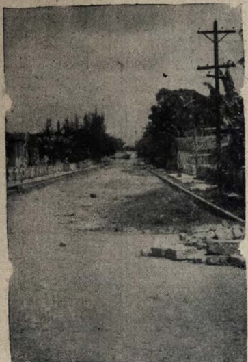
OBRA DE CALÇAMENTO DA PEDRO II CONTINUAM — Após ter realizado trabalhos de calçamento em considerável área da avenida Pedro II, uma das artérias mais movimentadas da cidade, o Governo do Estado dá prosseguimento ao plano de calçamento de toda aquela rua. Na foto, um fragmento dos serviços preliminares de aterro iniciados na Pedro II, no trecho que parte do cruzamento com a Maximiana Figueiredo em direção ao centro da cidade.

bastante habitada. A outra parte do foguete de oito metros de altura precipitou-se sobre Cabo Canaveral, a pouca distância de sua plataforma de lançamento.