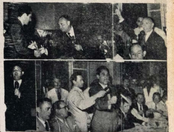
OS INATIVOS DE CAMPINA GRANDE HOMENAGERAM O GOVERNADOR PEDRO GONDIM — Ante-ontem, em Campina Grande, todos os funcionários inativos do Estado residentes naquela cidade, incorporaram tributar grande homenagem ao Governador Pedro Gondim, em sinal de gratidão pelo que fez o Chefe do Executivo em favor de numerosa classe dos aposentados. Consta a homenagem de um banquete oferecido ao sr. Pedro Gondim, no edifício do Grande Hotel, daquela cidade, participando ainda da manifestação personalidades das mais destacadas dos círculos administrativos e sociais de Campina Grande. As fotos da homenagem são fragmentos do acontecimento, vindo-se ao alto, a seguir: o Governador Pedro Gondim quando recebia das mãos do sr. Antonio Vital, presidente da União dos Servidores Inativos da Paraíba, valioso presente oferecido pelos promotores da homenagem; a direita, fala um dos oradores, o bel. José de Farias, Juiz de Direito aposentado. Em baixo, o sr. Antonio Vital, quando usava da palavra, seguindo-se outro fragmento em que se vê o Chefe do Executivo agradecendo a homenagem, lado do industrial Demônio Gondim Barreto (à direita), deputado Severino Cabral e Ten. Sebastião Calixto (à esquerda).

QUITO, 24 — Chegou ontem, ao aeródromo desta capital, um avião da Força Aérea Brasileira com que foi inaugurado o serviço aero-postal entre os dois países na chamada "Rota da Confraternização". A referida rota, através da Amazônia, foi aberta a vinte e um de fevereiro da mil novecentos e cinquenta e um por um avião de Força Aérea Brasileira, pilotado pelo major Rafael Andrade. O avião brasileiro fez a viagem sob o comando do brigadeiro Amaranth. (UPI).