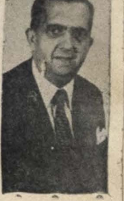
Ministro Fernando Nóbrega

Por esse razão, o Ministro Nóbrega deve estar recebendo no dia de hoje, os cumprimentos e as homenagens do alto mundo político e administrativo do Rio de Janeiro e da Colômbia Parahibana, na Capital Federal.