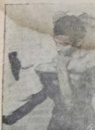
Nome do jogador ou técnico mencionado na imagem.

Auto Esporte Clube de Recife, Botafogo F. Clube, Sport Club de Recife, e Fluminense de Feira de Santana. O grupo será acompanhado por técnicos e dirigentes locais.