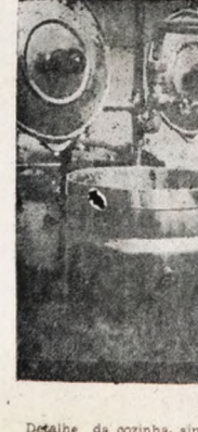
Detalhe da cozinha, ainda em fase de instrigação.