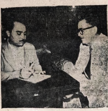
O Secretário da Agricultura quando falava à nossa reportagem.