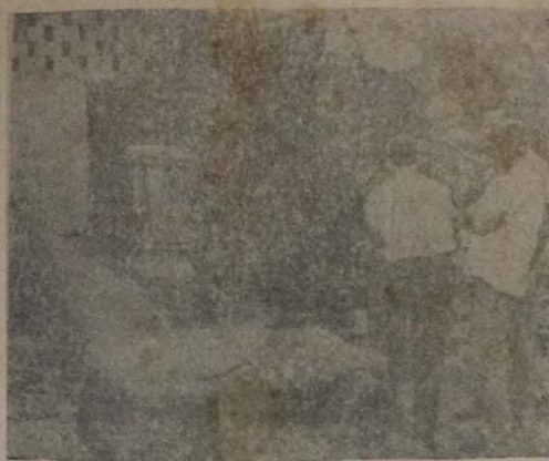
NOVAMENTE GUANDU A adutora do Guandu, considerada como "a obra do século" por muitos volta a inquietar os cariocas, por ter-se rompido com as últimas chuvas caídas na Velha Capital. No foto, os engenheiros do governo estadual guanabarrino olham de mãos nos queijos, os estragos causados pelas inundações, em uma das tubulações da adutora.

A adutora fechada, diz, Conclui na 7ª página