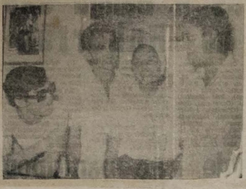
A EQUIPE DO SETE

OBRAS PRIMAS DO CONTO FANTÁSTICO — Escritores de renome estão reunidos numa coletânea de contos que trata do fascinante tema "o mundo misterioso do sobrenatural".