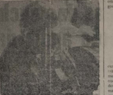
TOM JOBIM NOS USA

Nesta A PRAÇA DOS HOMENS SEM ALMA ou qualquer que seja o título dado em português, é um filme que se perde pela ausência da direção e pior coordenação de argumento e roteiro. O argumento possui todos os toques de negócio escrito por gente su. pericial, sem maiores conhecimentos políticos e psicológicos de que foi o exemplo nazista na Europa. O drama cria, do não convence, porque o realizador não soube explorar ou emprestar um desfecho com maior brilhantismo. O ator que caracteriza o comandante alemão é medíocre e o responsável pelo maior fracasso do filme.