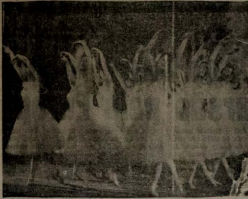
REAL BALLET NO CINEMA