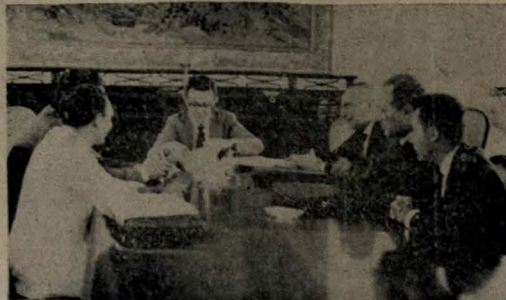
A adaptação da Constituição do Estado à nova Constituição federal foi um dos assuntos tratados na reunião do governador com a bancada da ARENA na Assembleia Legislativa.

O governador fará entrega ao ministro Albuquerque Lima, de amplo material, inclusive jornais e fotografias revelando a extensão dos prejuízos experimentados de lá para cá, nas recentes cheias.