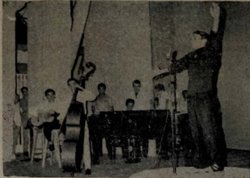
Na foto, o cantor Agápio Vieira quando defendia a música "Ritual de Amor", uma das três classificadas na segunda eliminatória do Festival Paraibano da M.M.P.B.

O resultado dos entendimentos ainda não são conhecidos, mas a Assessoria de Imprensa do Palácio da Redenção assegurou que a reunião foi produtiva.