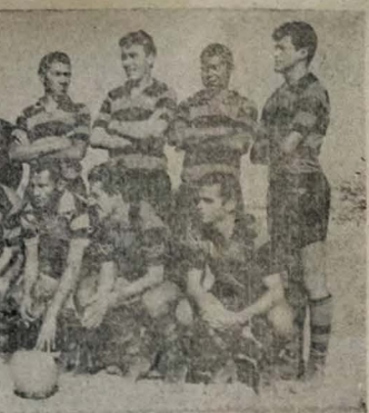
VENCEU APERTADO — Com um tento assinado por Simplicio, o Campinense, no figurante, venceu apertado a representação do América da Capital Pernambucana, pelo quadrangular interstadial "Paraíba-Pernambuco".

O proprietário do Circo Teatro Show, agradece a cooperação prestada pelos fiscais e menores da cidade de Exeque, pelos serviços que os mesmos vêm prestando não permitindo a penetração de crianças em horários não determinados, ou seja, nos espetáculos noturnos, obedecendo com isto as normas determinadas pelo Juiz de Menores da aquela cidade.