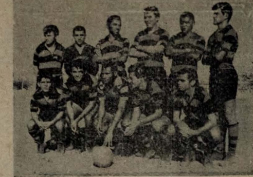
CAMPINENSE — Domingo, em Patos, o Campinense iniciará sua campanha no "Torneio dos Flagelados," ocasião em que enfrentará o Nacional no estádio "José Cavalcanti".

Laboaria Paraibana Visc. de Inhaúna, 122 — Fone, 2574 Mercado Central — Apartamento 56 — Fone, 2546