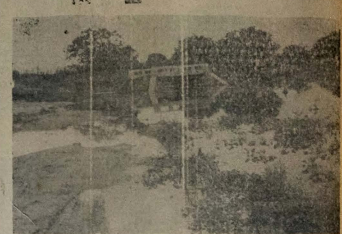
Outro pontilhão isolado, na estrada Belém-Católé do Rocha. O DER está esperando que as águas baixem para dar início aos trabalhos de recuperação

O governador deixou, ainda, na coiteira de Catolé do Rocha, uma ordem de sete milhões de cruzeiros à disposição das comissões que a cidade e Jericó, com importância destinada a custear eventuais despesas dos trabalhos de socorro prestados a população atingida. O levantamento sócio-econômico das vítimas, com o intuito preliminar para a reparação dos prejuízos pelo Governador, foi concluído