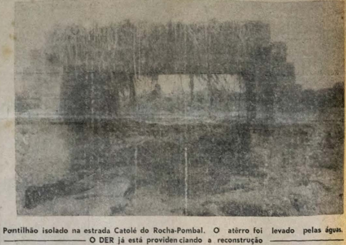
Pontilhão isolado na estrada Catolé do Rocha-Pombal. O aterro foi levado pelas águas. O DER já está providenciando a reconstrução