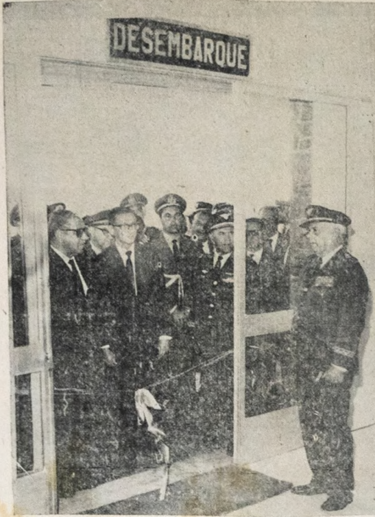
O presidente Costa e Silva e governador João Agripino preparam-se para cortar a fita simbólica da nova estação de passageiros do Aeroporto "Castro Pinto".