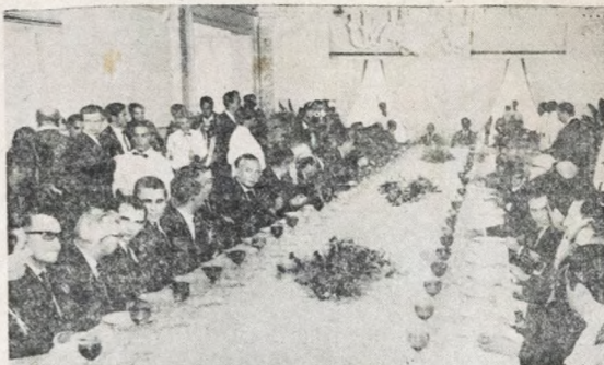
Aspecto do almoço que o governador paraibano ofereceu à comitiva presidencial e convidados, no Palácio da Redenção.