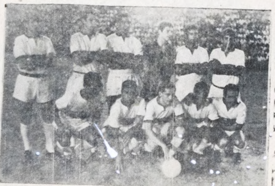
COM O BANGU — O Clube de Regatas Flamengo (foto), imprimiu mais um compromisso pela Taça Guanabara, domingo, sábado, a equipe do Bangu.

ças máximas, sendo de se esperar um espetáculo dos melhores. O jogo reveste-se do aspecto de autêntico "tríplice" quando os cariocas tentariam provar que (Conclui na 7ª Pag.)