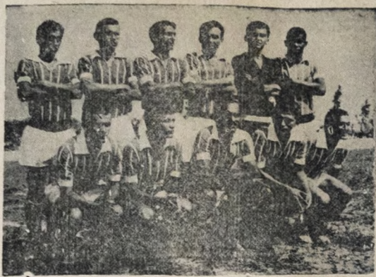
DE FOLGA — O Esporte de Patos (visto no flagrante), que jogará com o Treze domingo, em Patos, vai folgar nesta rodada já que o alvinegro serrano tem compromisso na Taça Brasil.

A equipe alvazulina, que muito ao contrário do Esporte do Nacional de Patos, dois bons valores do futebol interiorano, mas que na atual temporada não vêm encontrando o seu melhor futebol, o representante guarabirense é o inverso, vem com segundo bons resultados a cada jogo que disputa.