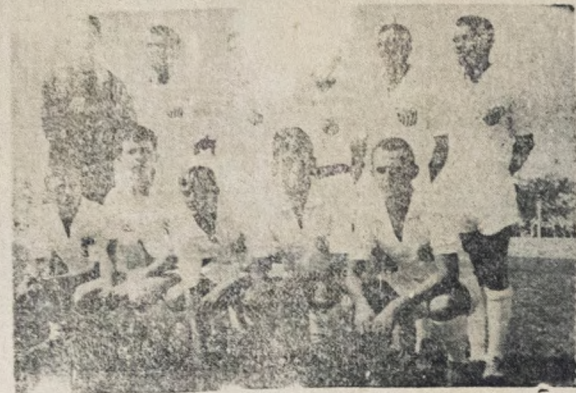
TREINA HOJE — Visado a pelega ante o Botafogo, o Santos, no clichê, estará realizando coletivo esta manhã no campo do ABC em Jaguaribe.