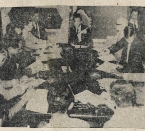
Reunido profissionais da imprensa filiada e escrita da Capital, ontem, em Petróleo, o governador João Agripino concedeu uma entrevista coletiva, relatando os benefícios que trouxe para a Paraíba, a recente visita do presidente Costa e Silva. (Maiores detalhes na 8ª. página desta edição).