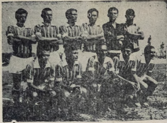
BUSCA VITÓRIA — O Esporte Clube de Patos, no flagrante tentará domingo sua primeira vitória, por ocasião do jogo com o Nacional, em pelega válida pelo Certame de Profissionais.

Nós trabalhamos pelo esporte amador da Paraíba.