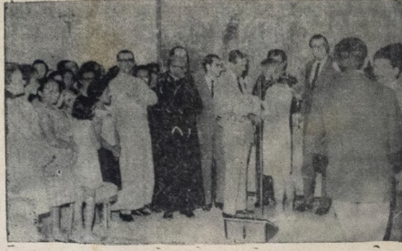
Os prolaboristas readmitidos foram ao Palácio da Redenção homenagear o governador