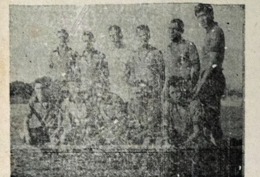
UNIÃO — Mesmo sem ter decepcionado, o União voltou a perder no "extra 67", desta feita, para o Botafogo por 1x0.

Pórtio 4 x 2 Braga Guimarães 2 x 0 Académica Setúbal 1 x 0 Sintense