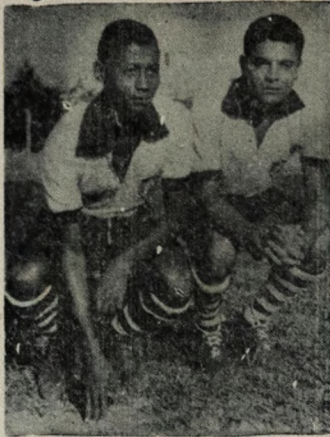
GRANDE ATUAÇÃO — A ala-esquerda do ataque botafoguense teve um desempenho excepcional diante do União, em especial o apolador Santana, que jogou sério e para a equipe alvinegra.

O árbitro do encontro foi o sr. Luiz Gonzaga Ferreira, auxiliado nos flancos pela dupla, Genival Batista e José Firmino. A renda da peleja ultrapassou a marca dos 6 mil cruzeiros novos, e os dois clubes utilizaram os seguintes jogadores: Campinense — Itamar, Valdeir, Ton, Veltor e Zorinho; São Paulo e Coritiba — César, Paulinho (Debinha), Lelé, Fátima e Debinha (Odiseu); Treze — Augusto, Paulo, Lucas, Antônio e Jansen; Lacerda e Zeca; Lima, Zé Luiz, Cordeiro e Noelma. O próximo jogo será a partida diante do Botafogo no Presidente Vargas, enquanto o Campinense está a caminho contra o União, no Leonardo da Silveira.