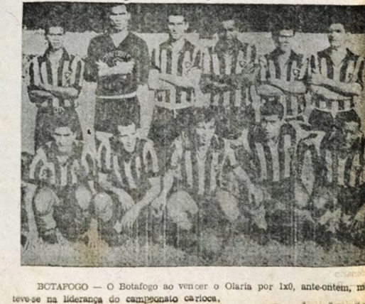
BOTAFOGO — O Botafogo ao vencer o Olaria por 1x0, anteontem, manteve a liderança do campeonato carioca.