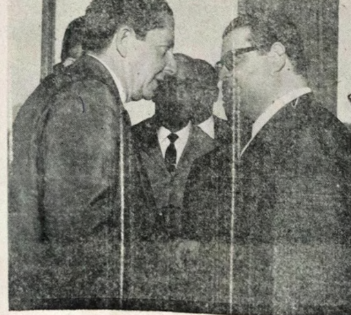
O presidente da Caixa Econômica Federal da Paraíba, sr. Cláudio de Paiva Leite cumprimentando o ministro da Fazenda, sr. Delfim Neto, na reunião do Conselho Superior das Caixas Econômicas, realizada no Rio de Janeiro, e da qual participam representantes da Paraíba. (Notícia na 3a. página).

O governador João Agripino vem mantendo uma série de contatos entre o Rio, São Paulo e Brasília, visando a caminhar a solução de diversos problemas junto aos órgãos federais e a grupos financeiros e industriais do Sul do país. Dentre esses assuntos, destacam-se a revisão do preço mínimo do sisal, financiamentos para a pavimentação do chamado "Anel do Brejo", assinatura de convênios para construção de casas populares e apressamento do projeto do Hotel Tambá.