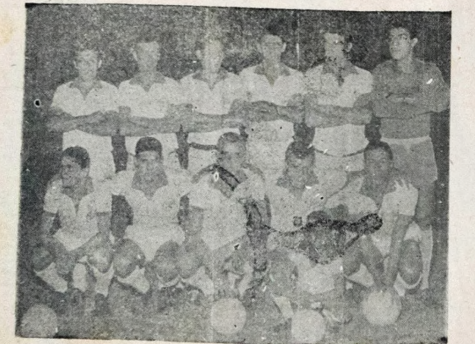
COM O CRUZEIRO — O Clube Náutico prosseguirá sua participacão na Taça Brasil enfrentando esta noite o campeã brasileiro, no caso o Cruzeiro de Belo Horizonte. A peléja vem despertando grande expectativa da torcida nordestina que espera outro sucesso do pente empinado pernambucano.