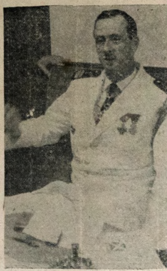
Philippe de Gaulle, filho de Charles de Gaulle, chegou ao Rio, comandando a fragata "Suffren" e assinando, em entrevista coletiva, que é contra a participação de militares na vida política.