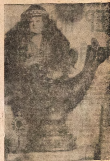
Iemanjá — rainha do mar — festejada hoje pelos terreiros de umbanda de todo o Brasil. A Federação dos Cultos Africanos da Paraíba também estará comemorando o dia de dona Janaina.

Também o charuto, a farofa — servida num alguidar de barro — fazem parte do ritual. A vela se cha-