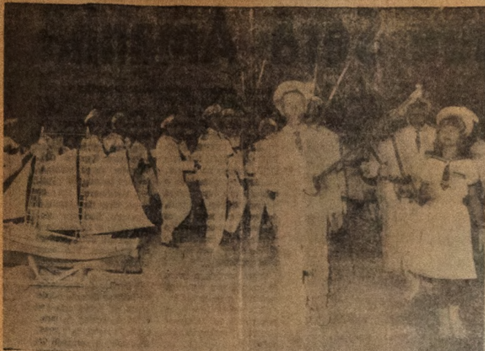
Aspecto da tradicional Nau Catarineta da cidade de Cabedelo, que ontem esteve se apresentando nos festejos da Guila, no município de Lucena, a convite dos organizadores da festa e o Departamento de Folclore da Sociedade Cultural de João Pessoa. A Barca de Cã bedelô é uma das últimas existentes na Paraíba, o que vem comprovar a decadência dos nossos folguedos.

Antes de começar as sessões usam lavar o corpo com sal grosso para aliviar o corpo do males.