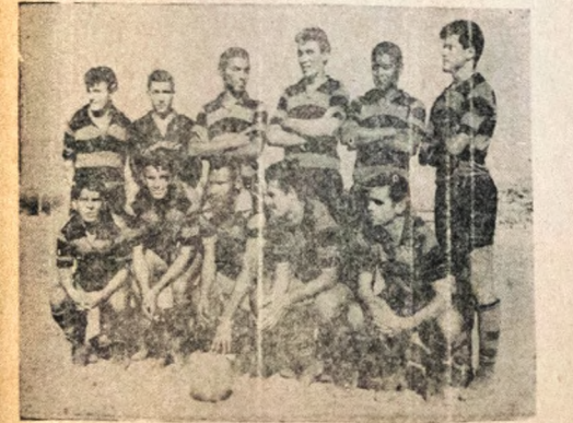
PODE DEFINIR — A equipe do Campinense Clube, que domingo enfrentará a representação do Treze no estádio municipal "Plínio Lemos", poderá definir o Campeonato de Profissionais, uma vez que qualquer resultado positivo levará mais um passo para conquistar o título da atual temporada.

circulares enviados pela Confederação Brasileira de Desportos: COPIA CONFEDERAÇÃO BRASILEIRA DE DESPORTOS Rio de Janeiro, 8 de novembro de 1967 Circular n. 136/67 Prezado Senhor Fera conhecimento de V. S. transcrevo abaixo o inteiro teor do ofício recebido do Conselho Nacional de Desportos. C B D Na íntegra, eis os ofícios: