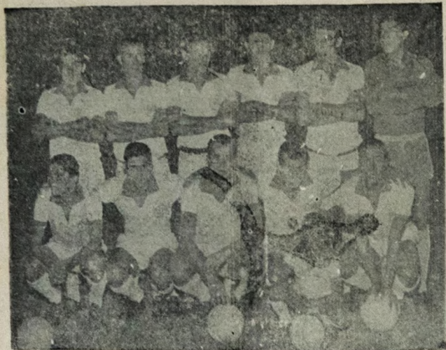
PODE VENCER — A equipe do Náutico, que na noite de ante-onTEM derrotou o Cruzeiro de Belo Horizonte por 3x0, na Ilha do Retiro, tem grande oportunidade para se classificar para a final da Taça Brasil.