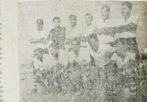
COM O BOTAFOGO — A representação do Treze, que derrotou ante-onTEM o Esporte Clube União por 4x0, jogará suas últimas esperanças domingo, quando enfrentará o Botafogo em nossa Capital.

A Federação Paranaense de Futebol marcou cinco jogos pelo Campeonato Juvenil, edição 67. Amanhã à tarde, tendo como palco o estádio Olímpico José Américo de Almeida, serão jogados três jogos abertos e dois jogos fechados. Logo após o jogo de abertura, será realizado o jogo de abertura do campeonato, tendo como adversário o São Paulo de Sorocaba, a representação local do S. Beneditino, 36 pontos: to enfrentará a Ferroviária de Araraquara.