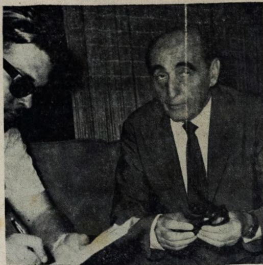
O ministro Leonel Miranda, falando à imprensa

Para atender a esse objetivo do Governo e para resolver, em termos definitivos, os problemas de saúde do povo brasileiro, o Ministério da Saúde adotou duas frentes de trabalho: a continuação e expansão do combate às doenças transmissíveis — atividades de medicina sanitária — e a formulação de uma Política Nacional de Saúde à altura das necessidades nacionais, definindo as diretrizes gerais de um plano de coordenação das atividades de proteção e recuperação da saúde, abrangendo, portanto, não só a medicina sanitária, mas também a assistência médica e todos os demais assuntos ligados à Saúde, assegurando-se a execução dessa Política através da reorganização administrativa do Ministério da Saúde.