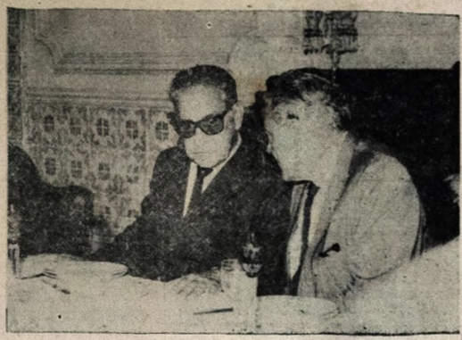
A atenção que o presidente Costa e Silva tem dispensado aos problemas do Nordeste e, consequentemente, da Paraíba foi uma das razões pelas quais a Assembleia Legislativa decidiu conferir-lhe o título de Cidadão Paraibano, que lhe será entregue hoje à tarde, em sessão solene no Teatro Santa Rosa. Na foto, o marechal Costa e Silva e o ministro dos Transportes, coronel Mário Andreazza, quando de sua última visita à Paraíba.