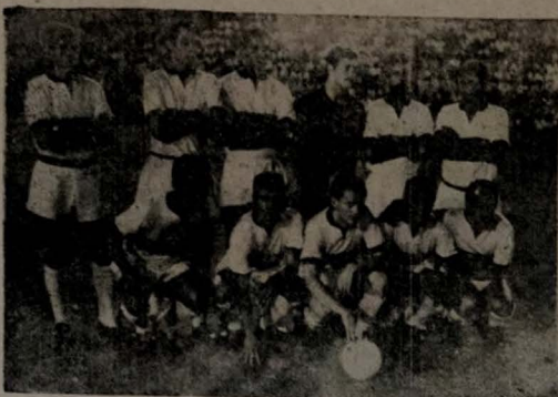
INTERNACIONAL — O Clube do Regatas Flamengo amanhã a tarde, no "Mário Filho", estará jogando com o Independente da Argentina, em amistoso de caráter internacional.

Foi presenciar, vem devotadamente autorizado, pelo Senhor Presidente desta Liga, convidar os Senhores Presidentes do Brasil Esporte Clube Recreativo, Vasco da Gama Esporte Clube, Esporte Clube São Paulo, Esporte Clube Esporte Clube de Bayeux, Santos Esporte Clube, São Sebastião Esporte Clube, Clube Municipal Desportivo e São Cristóvão Esporte Clube Recreativo, a fim de tomar parte na Assembleia Geral Ordinária a ser realizada na próxima Quinta-Feira, dia 2 de março de 1967, no endereço situado com a finalidade de eleger nova Diretoria para o biênio 67 e 68, como se tem Presidência, Vice-Presidente, Conselho Fiscal composto de três (3) Membros efetivos, três (3) Suplentes e a Junta Disciplinar Desportiva, composta de três (3) Membros efetivos e três (3) Suplentes, se poderão tomar parte na Assembleia Geral, Associação Geral, na 7ª. pag.