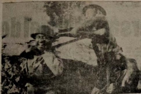
Uma semana de guerra, sete filmes, cada dia um, de amanhã até domingo, no Cine Municipal, o grande tema visto em todos os seus aspectos. A cena da foto é de "A Patrulha de Bataan" (Bataan), de Toy Garnet, o filme de quinta-feira, lançamento do Cinema de Arte.

— "Contra ou a favor do Führer?" — tal per- gunta, dirigida por um autônomo aos 35 ao jovem tenente Mauro, o qual, ao a tirar de sua mala uma foto, mas não outra saída (como ocorrer um dia "seu Hitler", consulto, sem dúvida, um dos meus res momentos esse "Aconteceu a Vinte de Julho", a cujo respeito o Antônio Barreto Neto quem me fazia um artigo.