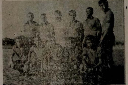
NOVO AMISTOSO — O Esporte Clube União (foto), será novamente "sparring", desta feita para o nosso selecionado de amadores, que também se prepara para disputar o certame brasileiro da modalidade