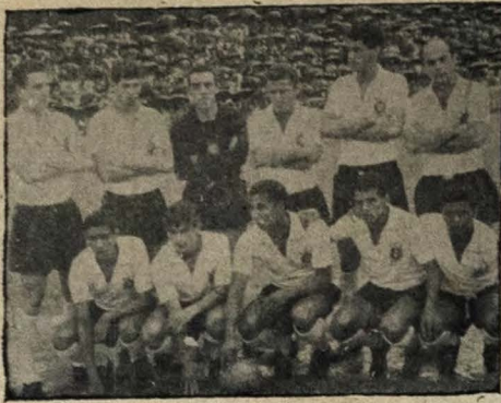
ESTREIA — Domingo à tarde o Convênio foto estrará no Campeonato Paulista de 67, quando terá pela frente o Guarani, no estádio do "Pacaembu"