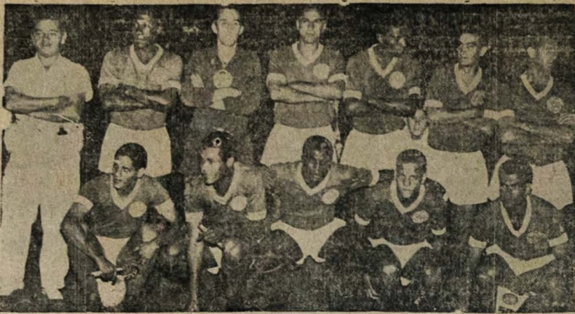
ESTREIA DOMINGO — A Sociedade Esportiva Palmeiras (foto), no próximo domingo fará sua estreia no Campeonato Paulista, edição 67, enfrentando no estádio "Eurico Mures" a equipe da Portuguesa Santista.