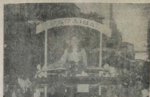
Bela de Paraíba sorri em carro alegórico