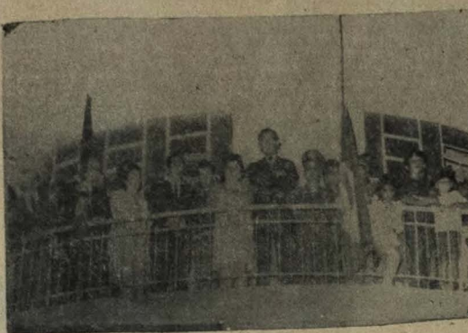
O reitor saudando as delegações participantes