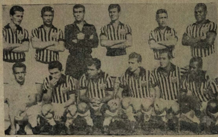
COMPROMISSO SÉRIO — A representação do Comercial de Ribeirão Preto (foto), apesar de atuar dentro de sua casa, tem hoje um compromisso sério pelo Campeonato Paulista, ao se defrontar com a Portuguesa de Desportos, em Ribeirão Preto.

Foram iniciados contactos, para realização ainda este ano, de um rally a uma Cidade, do Interior do Estado, não tendo em mente ainda qual a cidade escolhida, mas tudo faz crer seja Campina Grande ou Guarabira.