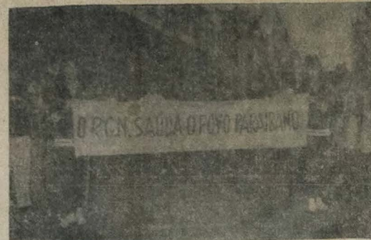
Sympatia e graça na saudação potiguar