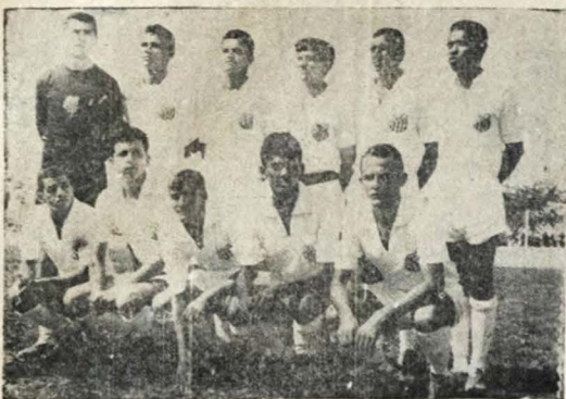
SO NO DIA 25 — A apresentação que o Santos realizaria domingo em Rio Tinto foi adiada para o próximo dia 25.

quadro principal do alvinegro abecedista. Visando este amistoso, os jogadores do ABC vem se preparando, no sentido de realizarem uma boa apresentação e conseguir um bom resultado diante da América.