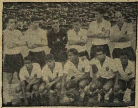
PERDEU O TÍTULO — O Esporte Clube Corinthians (foto), que era apontado como o mais sério candidato ao título de campeão do "Robertão", acabou por perder definitivamente o cetro com a derrota de ante-onde, frente ao Inter nacional de Porto Alegre.