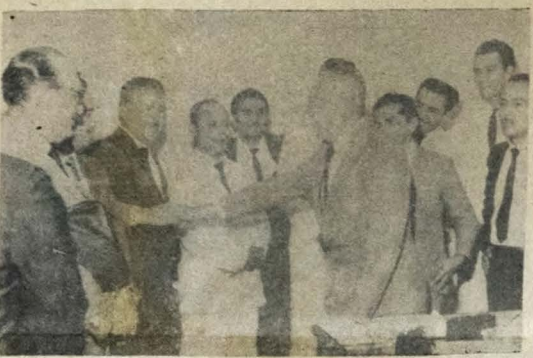
Recebendo cumprimentos dos vereadores