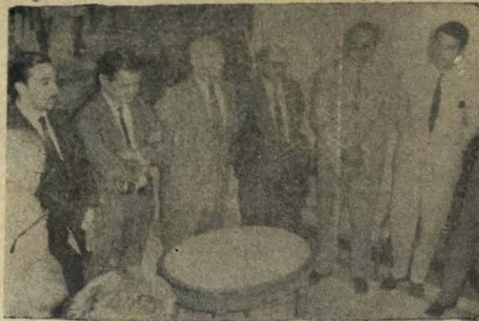
Agradecendo a visita dos deputados

O navio "Val de Cens", da NETUMA está viajando de Belém, com destino a esse porto, trazendo o primeiro grande carregamento de gêneros de primeira necessidade (açúcar, feijão, carne seca, batatas, cebolas, azeitonas) e produtos industriais (cimento, lamina, dos de ferro, inseticidas). É o primeiro dos navios de cabotagem esperados para junho.