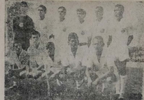
SANTOS — O quadro do Santos, no clichê, possivelmente será o adversário de amanhã do Botafogo em amistoso a ser travado na "Graça"...