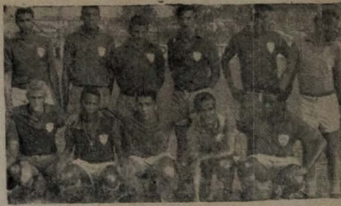
PORTUGUESA — Esta é a equipe da Portuguesa santista que hoje à noite estará medindo forças amistosas com o Corinthians na Ilha do Bispo.