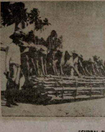
"CURRAL DE PEIXE"