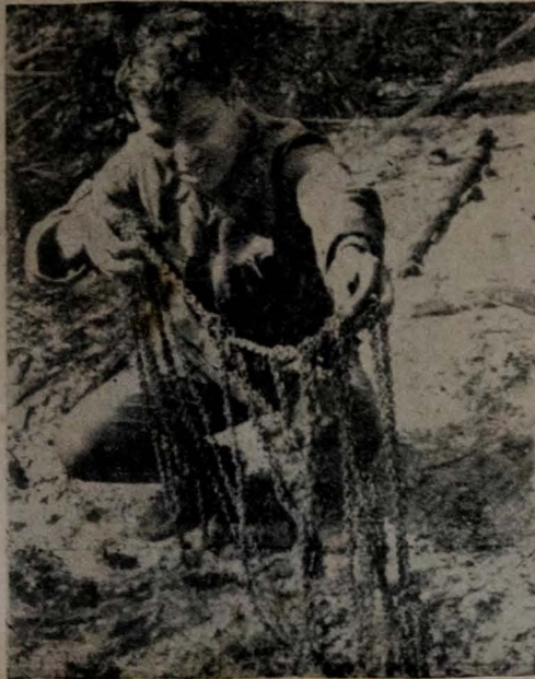
Um combatente sul-vietnamita arde correntes usadas por guardas vietnôses em prisioneiros de um campo conquistado pelas tropas governistas nos dias 14 e 15 de janeiro último. Esse campo de prisioneiros está localizado na região do Delta do Mekong, cerca de 173 quilômetros a sudeste de Saigon. Um dos sete correntados ainda encontrados com vida condizia o combatente sul-vietnamita ali a uma bala comum onde estavam os cadáveres de 44 pessoas, em sua maioria civis, inclusive mulheres e duas crianças. O sobrevivente contou que as guardas vietnôses mataram a bala, punhaladas e granadas de mão o rebanho de prisioneiros, quando se aproximavam as tropas governistas.

No programa de agropecuária, o DNOCS despendará 23 bilhões, 908 milhões e 501 mil cruzeiros. Para o setor de energia reservou 14 bilhões e 102 mil cruzeiros. Em transporte investirá 4 bilhões, 785 milhões e 983 mil cruzeiros. Na execução dos planos de saneamento e acuidade aplicar-se-ão, respectivamente, 13 bilhões, 522 milhões e 174 mil cruzeiros e 39 bilhões, 627 milhões e 756 mil cruzeiros.