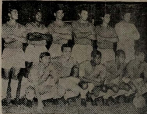
ESTREIA — O Cruzeiro, campeão brasileiro de 66, estreia hoje à tarde no "Roberto Gomes Pedrosa" enfrentando o Atlético no "Mineirão"

Nacional e Esporte finalizarão esta tarde em Patos, no estádio "João Cavalcanti", uma série de três amistosos. No primeiro jogo o Esporte ganhou por 2x0 e na segunda partida houve um empate de dois pontos. Hoje, portanto, as nacionais esperam uma total reabilitação, apesar do Esporte estar com uma equipe mais solidificada e com mais valores. Para melhor garantia do espetáculo, as maiores forças do futebol sertanejo solicitaram a FPF a indicação de um trio de arbitragem, tendo sido escolhido o apito Conclui na 7a. pág.