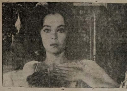
UMA DAS VERDADES