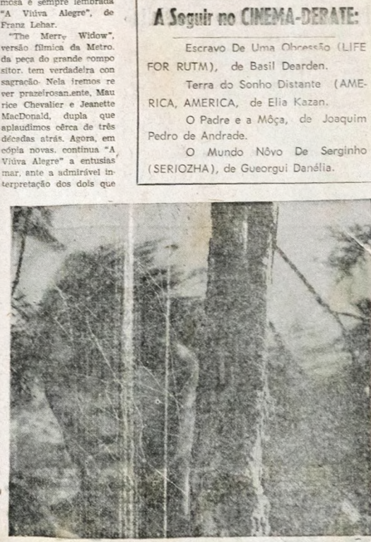
"A Infância de Ivan" (Ivanovo Destro), de Andrei Tarkovsky, um dos mais importantes filmes de 1967, um dos melhores lançamentos do Cinema-Debate.