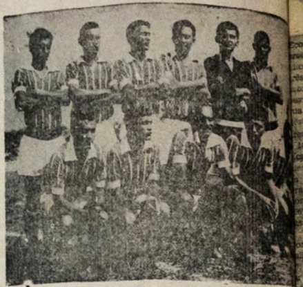
DEU ADEUS — Ao empatar com o União, o Esporte de Patos encerrou o campeonato paraibano de profissionais, pois posterior classificação para os turnos finais do extra-67.