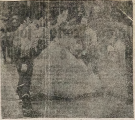
Cena de "A Grande Valsa"