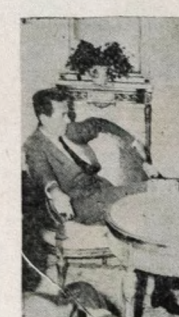
Paschoal Carlos Magno com o governador

O embaixador Paschoal Carlos Magno esteve ontem em João Pessoa, ocasião em que manteve contatos com o governador João Agripino e o Feitor Guilherme Martins da UFP. O embaixador veio conversar com autoridades paraibanas a fim de acertar a participação deste Estado no V Festival Nacional de Teatro de Estudantes, a ser realizado em 11 de janeiro próximo, na Guanabara.