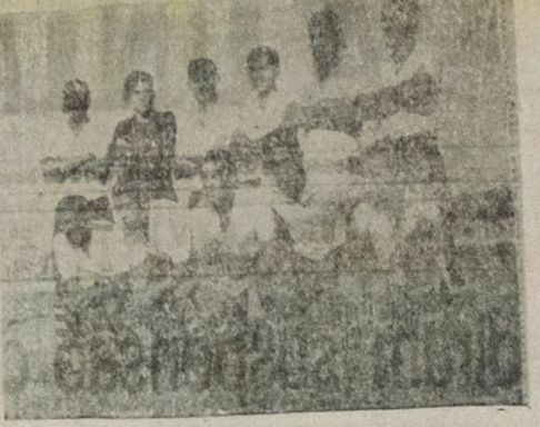
A equipe do Treze (Foto) jogando à noite passada em Maceió empatou pelo marcador de 1x1, com o CSA local.