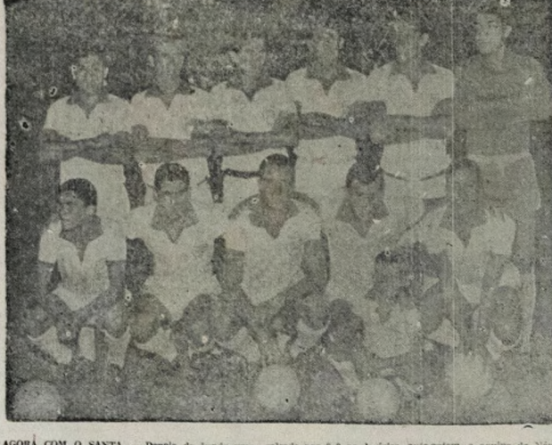
AGORA COM O SANTA — Depois de imorar uma rodada por fora no América, ante-ontem, a equipe do Náutico (foto) voltará a jogar na próxima quarta-feira com a equipe do Santa Cruz pelo Campeonato pernambucano.