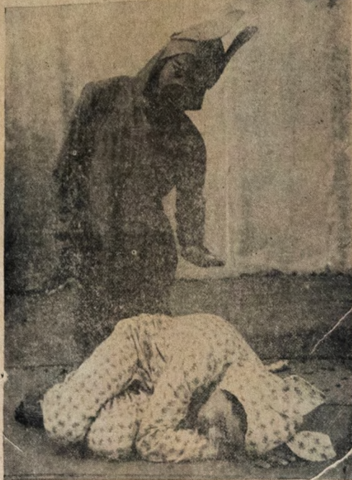
Cena da peça infantil "Jerico, Xarú S/A", que será levada pelos seminários de Ypuarana, amanhã, no Teatro Santa Rosa.

WASHINGTON, 10 (A União) — Voltou o Presidente Johnson a afirmar que os Estados Unidos continuarão dando sua ajuda militar ao Vietname do Sul, até que cesse a agressão comunista contra aquele país e se restabeleça a paz.