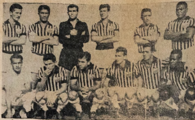
COM O COMERCIAL — O Santos (no flagnan. te) volta a jogar esta noite pelo Campeonato paulista, quando terá como adversário a representação do Comercial, em partida que será desenvolvida na cidade de Ribeirão Preto.

Sequenciando a rodada ríspide, jogará na cidade de C. Grande, no estádio municipal "Plínio Leiros" os quadros do Esporte Clube de Patos e Campinense Clube, com o quadro rubro-negro com amplas possibilidades de manter sua liderança, uma vez que atuará com o calor de sua torcida, fato que poderá ter uma grande influência para levar o Campinense Clube a uma vitória.