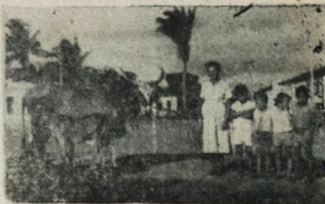
Uma agricultora, em Serra da Raiz, recebe um trato financiado pelo BEP, por intermédio da Cooperativa Agrícola da localidade