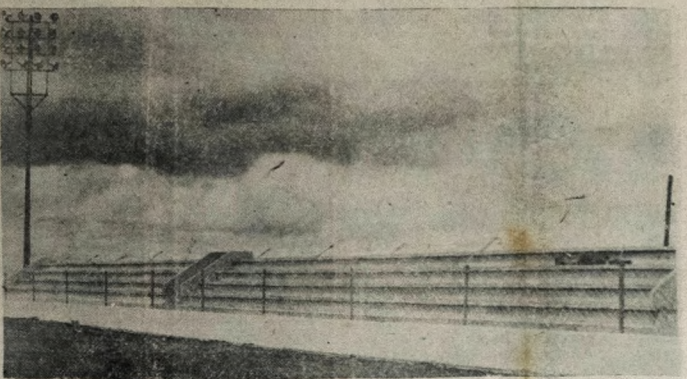
Na tarde de hoje, os passageiros irão receber o novo "Estádio Leonardo da Silveira", o popular "campo da Graça", inteiramente recuperado pela administração pública, escritas e, sobretudo, um novo gramado; serão inaugurados pelo governador João Agripino, como convidado especial do chefe do Executivo Municipal. Espera-se uma quebra de recordes de renda nesta Capital, para que estreiem a nova roupagem do "Leonardo da Silveira", que hoje "dará o ar-de-sua-graça". (Veja maiores detalhes na página esportiva de hoje).