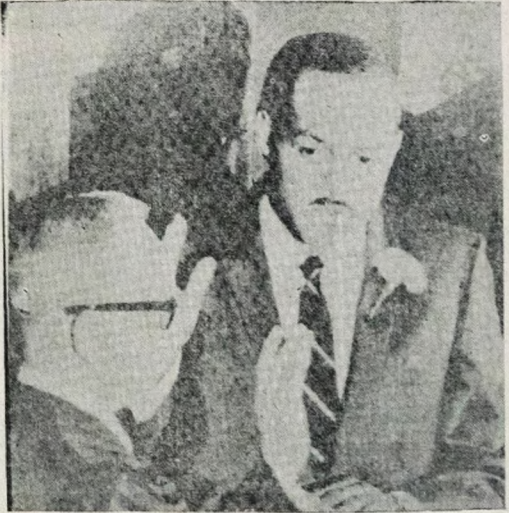
O negro Carl B. Stokes, democrata, de 40 anos de idade, tomou posse antontem, no cargo de prefeito de Cleveland, estado de Ohio, a primeira grande cidade dos Estados Unidos a ter um prefeito negro, embora sua população possua uma esmagadora maioria branca. Sua campanha foi baseada no "slogan", NAO VOTE NO NEGRO- VOTE NO HOMEM. Na foto, Stokes presta seu juramento perante o juiz-presidente da Suprema Corte dos Estados Unidos.

Por outro lado, um representante da Confederação dos Servidores Públicos do Brasil seguiu para Brasília, a fim de acompanhar a votação da emenda constitucional, que institui a aposentadoria aos 30 anos para os funcionários estaduais e municipais.