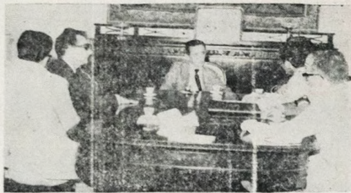
O governador com os médicos campinenses, em Palácio

dentro das peculiaridades de cada região.