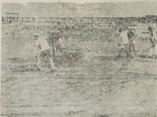
O GRAMADO — A prática do futebol exige um gramado em excelentes condições e a «Graça», após os trabalhos de restauração da Prefeitura de João Pessoa, nesse setor, pode rivalizar com outros estádios brasileiros.