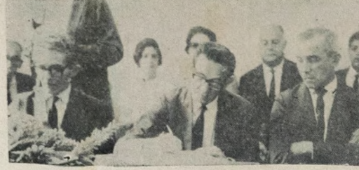
O governador João Agripino ao assinar o termo de posse dos novos membros do Conselho Estadual de Educação.