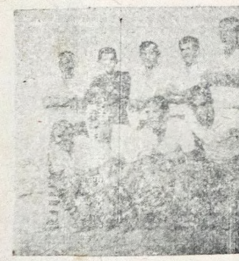
PODE SE RECUPERAR — No encontro de amanhã com o Botafogo, a equipe do Treze (no clichê) pode se recuperar da derrota de quarta-feira contra o Esporte Clube União.

Prezados Rapazes maiores de 18 anos, que tenha boa conduta, possam no mínimo curso de Admissão, para servir em Organização de Vendas, como Agente à Demissão. Tratar — Rua Silva Jardim, 845, Centro. Horário comercial das segunda-feiras aos sábados, pela manhã.