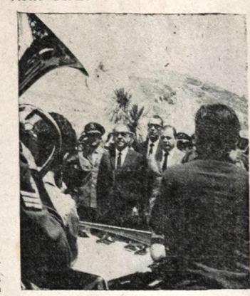
Depois de declarar inaugurada a segunda pista au- rodória "Presidente Dutra", que liga São Paulo à Guanabara, o presidente Costa e Silva, retornou ao Rio de Janeiro, acompanhado por ministros e assesso- res. No flagrante, o chefe do Exército no local da inauguração, nas proximidades de Vila Mars, ouve perfurado, a execução do Hino Nacional.