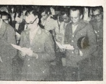
Associando-se às comemorações do Dia Nacional de Ação de Graças, o gover- nador João Aripino mandou celebrar, às 20 horas da última quinta-feira, um "Te Deum" na Catedral Metropolitana, ao qual compareceram autoridades civis e militares, auxiliares da administração e grande número de funcionários públicos. A foto é um flagrante da cerimônia, realizada em primeiro plano, o governador e o comandante da Guarnição Federal da Paraíba, general Vintius Nazareth Notare.