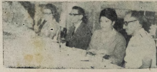
Aspecto do almôço oferecido pelo Governo do Estado, no Palácio da Redenção ao comandante e oficiais do III Distrito Naval.

A III SETP será encerrada hoje, as 10hs, com uma palestra do Secretário de Educação e Cultura, professor José Medeiros Vieira, que falou sobre o tema: "Problemas Educacionais da Paraíba".