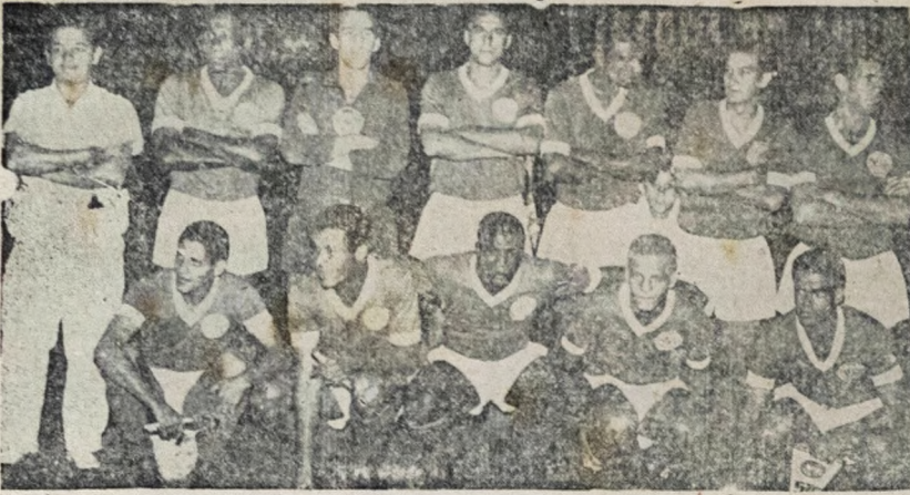
— Sociedade Esportiva Palmeira (no clichê) e São Paulo, líder absoluto do certame paulista, realizarão esta noite no estádio do Pacaembu o tradicional clássico bandeirante.

A tabela do Campeonato de Profissionais marca para a tarde do próximo domingo a realização de mais dois encontros, em andamento as disputas do terceiro turno da maratona patrocinada pela Federação Paranaense de Futebol.