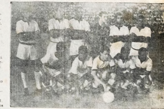
LIDERANÇA AMEAÇADA — O Botafogo, líder do Campeonato Carioca, tem esta noite sua posição ameaçada, pois enfrentará um dos mais difíceis adversários, no caso o Clube de Regatas Flamengo (foto).

Tratar com seu proprietário à Avenida Pedro — 1002, ou, aos domingos na referida granja.