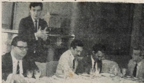
Almoçando com repórteres políticos, no Rio, o ministro da Fazenda mostrou-se otimista com os resultados da política Econômico-Financeira do Governo afirmando que, se houve aumento de impostos, os preços dos produtos básicos se mantiveram numa posição de estabilidade "que surpreendeu a todos". Anunciou também emissões elevadas em dezembro, assegurando no entanto que haverá restituição do Tesouro Nacional durante Janeiro e Fevereiro. (Foto ASP).

HONG KONG, 29 (A União) — Policiais de Hong Kong continuam em busca dos três assaltantes comunistas que assaltaram a punhalada de um policial. Continua de pé a oferta do Governo a recompensa de oito mil dólares pela captura dos assaltantes.