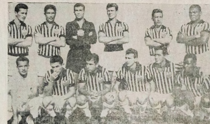
PERDEU — O Comercial de Ribeirão Preto, no flagrantemente derrotado pelo Botafogo pela contagem mínima, em partida válida pelo Campeonato Paulista realizada anteontem na cidade de Ribeirão Preto.