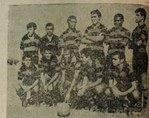
AMEAÇADO — O Campinense Clube, apesar de ter transformado a campanha, tem sua posição ameaçada hoje contra o Esporte de Patos, jogo que se apresenta bastante difícil para os rubroneiros.

ESPORTE — Celmarcos, Lira, Orlando, Vavê e Zezé; Toinho e Didi Walter Dedé, Talvanes e Foguete.