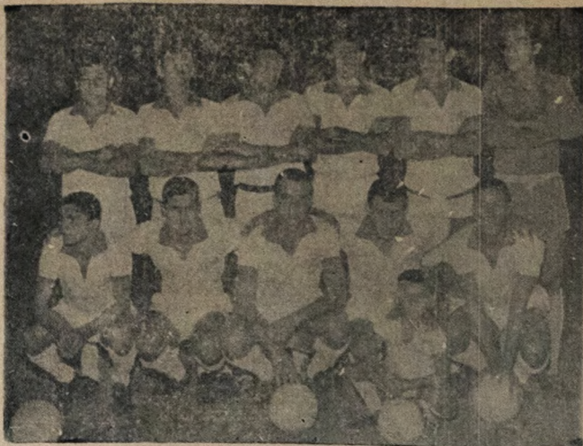
NAUTICO — Esta é a equipe do Náutico Capibaribe que amanhã, em Fortaleza, terá o América pela segunda vez na "Taça Brasil". Os pernambucanos serão classificados com um empate.

Aprová terá início às 7 horas com o chamado