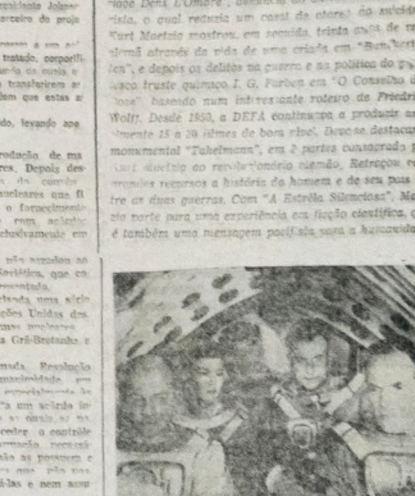
KURT MAETZIG Kurt Maetzig nasceu em Alemanha Oriental. É o diretor de "O Auto da Cobiça".

DE ESFORÇOS DOS EUA WASHINGTON — O Presidente Johnson declarou que os Estados Unidos não se comprometem a não produzir armas nucleares, mas a não proliferar essas armas para outros países. Uma finalidade do tratado é facilitar os contactos entre os investidores estrangeiros e os empresários latino-americanos. O tratado também tem como finalidade promover o conhecimento das condições de investimentos em vários países da América Latina, através de um programa de pesquisas que será apresentado sob a forma de um relatório de trabalho.