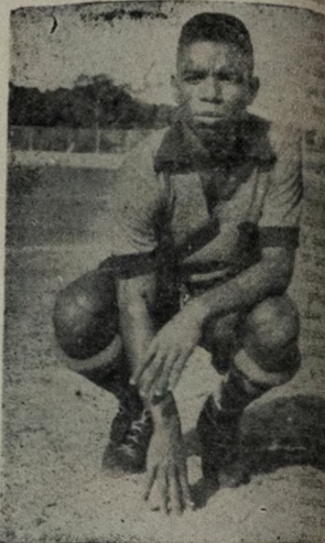
PUNIDO — O jogador Trial, no clichê, punição do TJD, que lhe impôs uma multa de NCr$ 20,00.

Já o Campeonato Juvenil da FPF, edição 67, marca para domingo no primeiro horário no Estádio Olímpico o encontro entre Santos e Jangadeiro com o "time da Palmeira" sendo apontado como franco favorito da contenda.