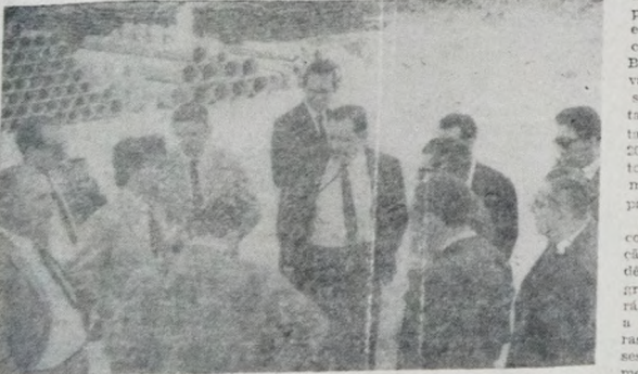
Os empresários paulistas ficaram impressionados com as possibilidades do Distrito Industrial de João Pessoa.