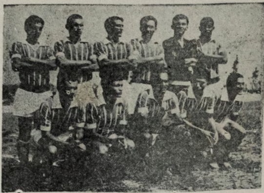
AMISTOSO — O Esporte de Patos (foto) buscará sua reabilitação no amistoso desta noite com o Ibis da capital pernambucana, no Estádio Pref. to "José Cavalcanti".