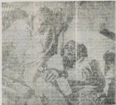
Rumo a Vênus — "A Estrela Silenciosa"