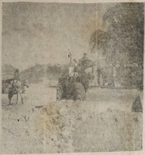
Desbravando novas fronteiras, rasgando estradas construídas pelo esforço conjunto de convênios firmado entre o Governo do Estado/SUDENA/Altares para o Progresso, o DER-Pb vem empreendendo esforços para interligar municípios povoados com boas rodovias, a fim de participar no surto de desenvolvimento a que se propõe incrementar o atual interior.