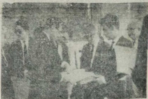
Foi entregue, ontem, ao governador João Agripino, para ser encaminhado à SUDEVE, o projeto para instalação da indústria Celulose Papeis do Nordeste S/A, nova empresa que será instalada na Paraíba, quando dos beneficiários dos artigos 34, II, a Celulose Papeis do Nordeste fará um investimento total de 3 bilhões 800 milhões de cruzeiros antigos e proporcionará 155 empregos diretos. A nova indústria aproveitará matéria-prima local, sendo a principal o bagço da cana de açúcar, devendo usar equipamento totalmente nacional e fornecer papel das indústrias graficas do Nordeste. O projeto da Celulose Papeis do Nordeste foi elaborado graças a financiamento da Secretaria de Planejamento, num total de 15 milhões de cruzeiros antigos. A entrega do projeto, foi feita ao governador pelos srs. Lourenço de Miranda Freire, Agnaldo Gouveia e José L. Wrenco, diretores da nova indústria.