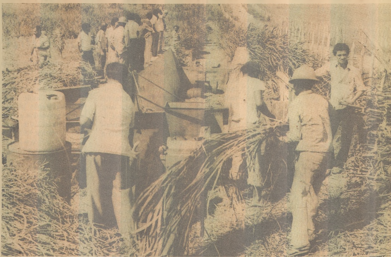
Técnicos e produtores participam de excursão sobre a utilização do silo trincheira