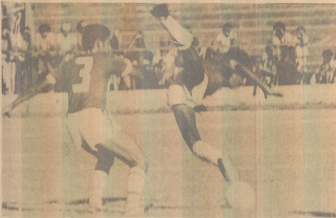
Auto e Nacional-C jogam hoje no Almeidão, num jogo sem motivação

Em tempo: João Máximo toma posse no dia 7 de setembro.