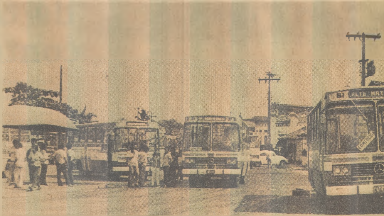
Os pessoenses passam a pagar amanhã 7 cruzeiros por uma passagem nos coletivos

Afirmou ainda que "contudo é bom frisar, se antes decorridos cinco anos da data de lançamento dos referidos créditos, for restabelecida alíquota diferente de zero, em produto objeto da atividade industrial, os créditos remanescentes poderão ser deduzidos na saída do novo produto tributado, já que tais créditos constituem dívidas passivas da União nos termos do Decreto nº 20.910, de 06 de janeiro de 1932, podendo, assim, ser reclamados."