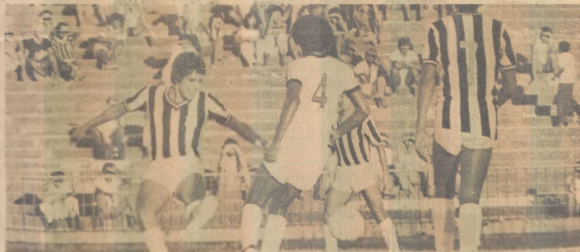
Treze joga com o Santos hoje, sem perspectivas de boa renda, em Campina

O Gringo vai aproveitar a oportunidade e fazer uma nova proposta no tocante ao período do empréstimo um mínimo de seis meses, caso a direção do Rio Negro não aceite, o Treze vai desistir da negociação e procurar outro jogador para a posição.