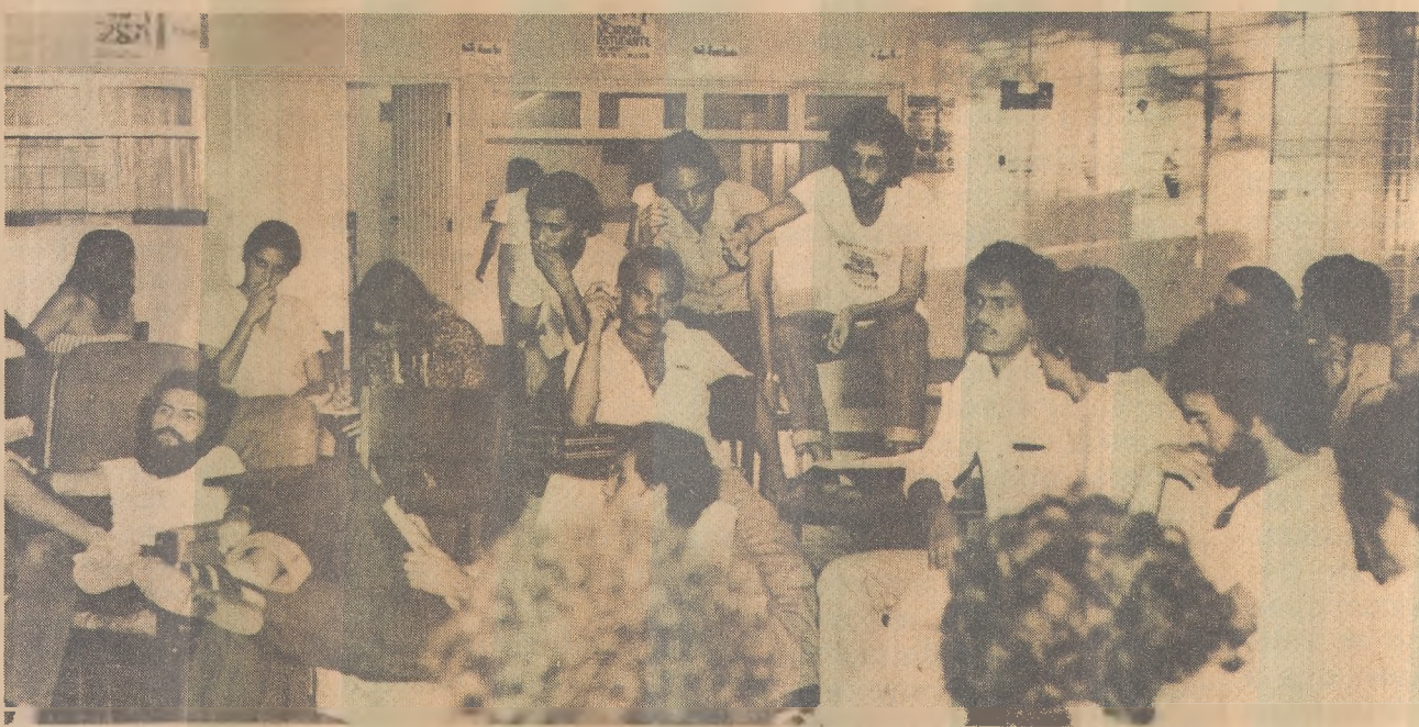
Universitários querem verbas para restaurante, mas já pensam em movimento grevista