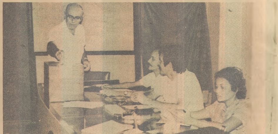
A votação durou 12 horas