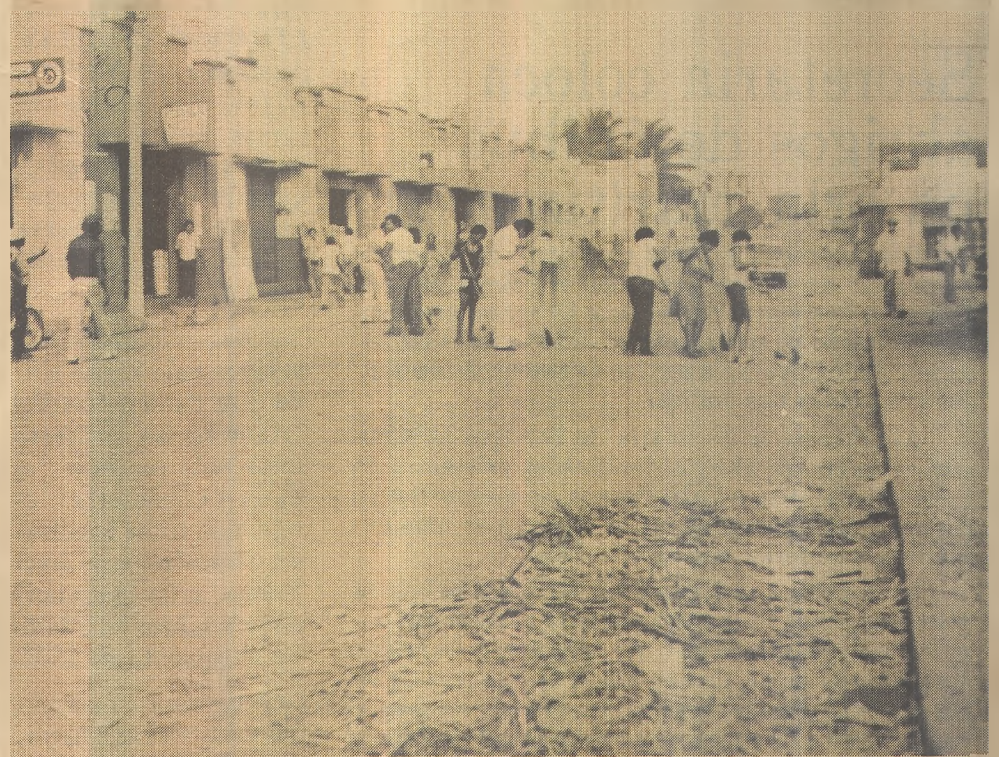
Comerciantes fazendo limpeza na cidade

Por outro lado, Erivan pede ao Prefeito para que, junto a Saelpa, procure o mais breve possível iluminar grande parte da cidade, que hora se encontra em plena escuridão, como é o exemplo do Bairro Luzia Maia, até mesmo em frente ao Centro de Ensino Fundamental.