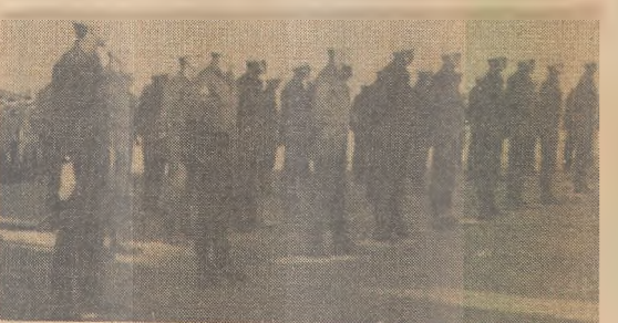
A Polícia Militar da Paraíba conta agora com mais 42 novos soldados, recém incorporados

Por motivos de ordem pessoal, o colunista não viajou ao Rio, como noticiamos ontem, prosseguindo, pois, no dia-a-dia do nosso trabalho. E aqui estamos.