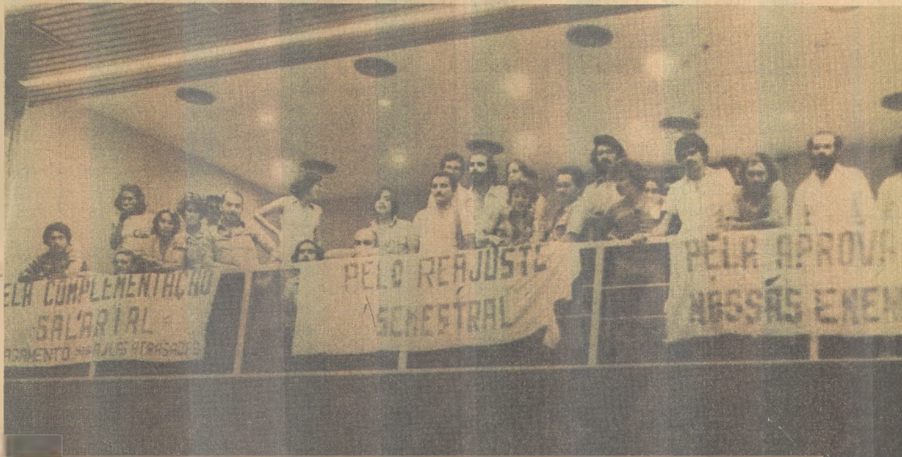
Professores foram à Assembléia reivindicar a aprovação do Estatuto do Magistério