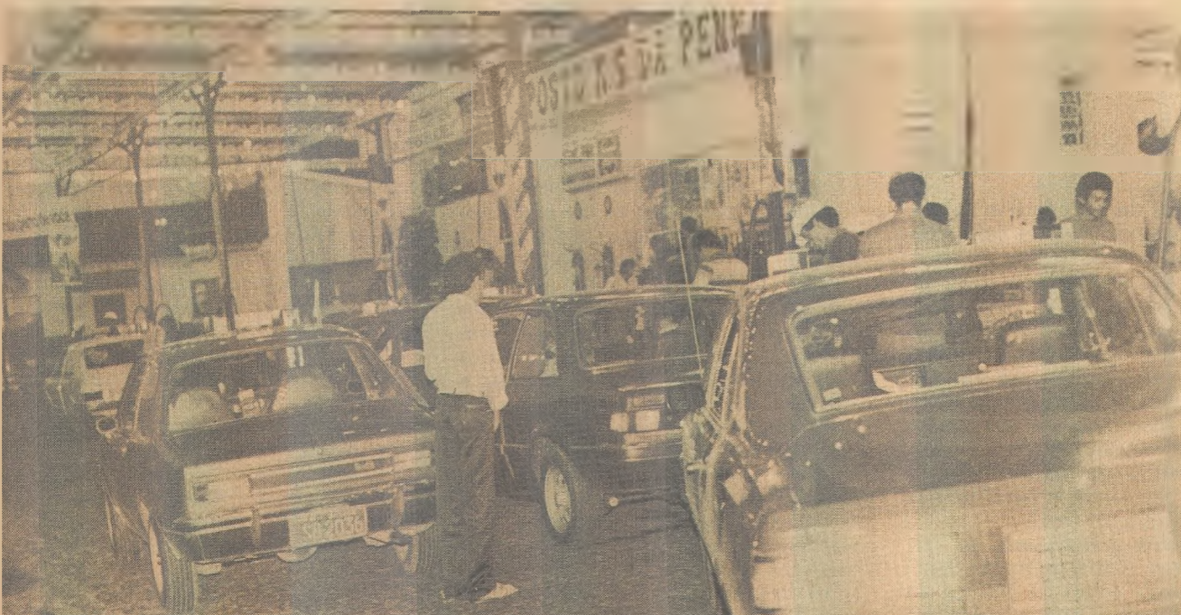
Os novos preços dos combustíveis provocam longas filas nos postos de João Pessoa

A verba, de 95 milhões, está depositada na agência do Banco do Nordeste, de Campina Grande (69 milhões de cruzeiros), e na do Banco do Estado da Paraíba, de Serra Branca (26 milhões).