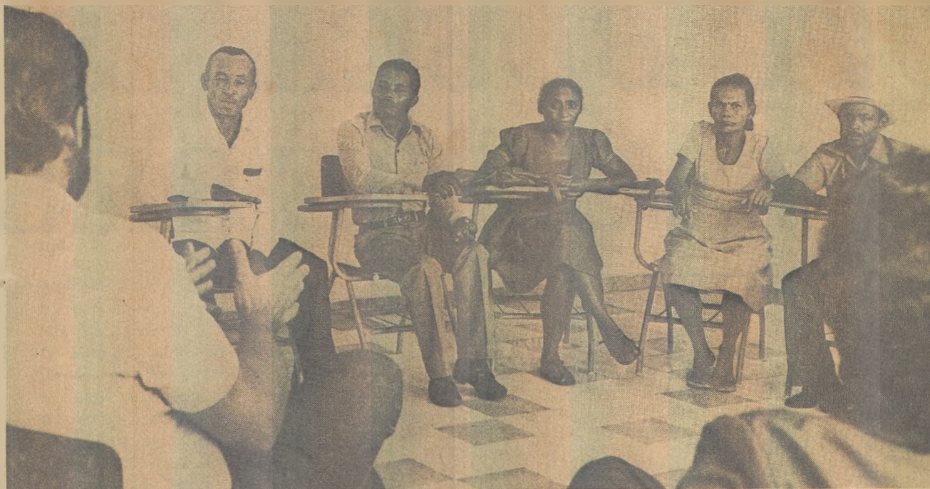
Camponeses revelam que não existem mais proibições nas terras da fazenda Camucim