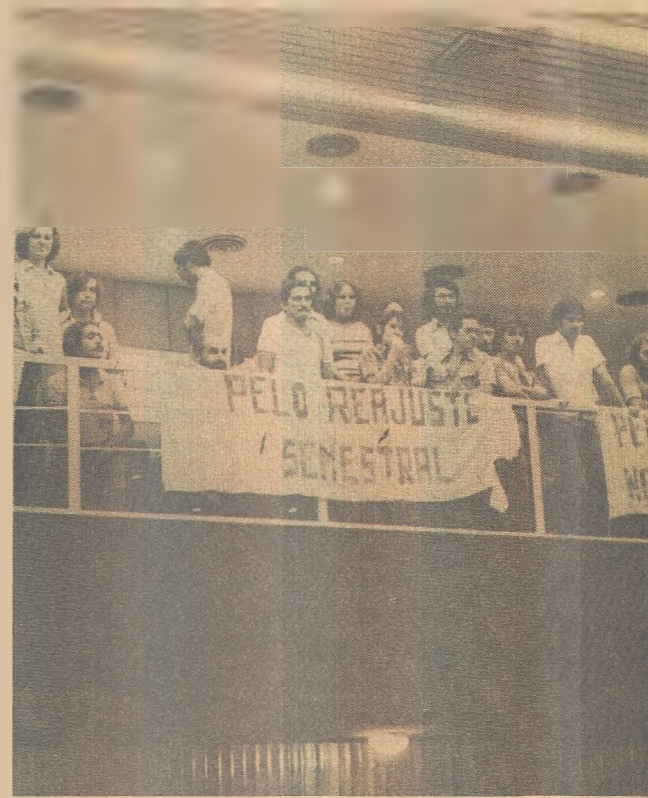
Professores acompanharam a votação na AL

Ditas emendas tiveram, como é sabido, a inspiração da AMPEP e da UFPB, esta através do Centro de Educação - CAMPUS