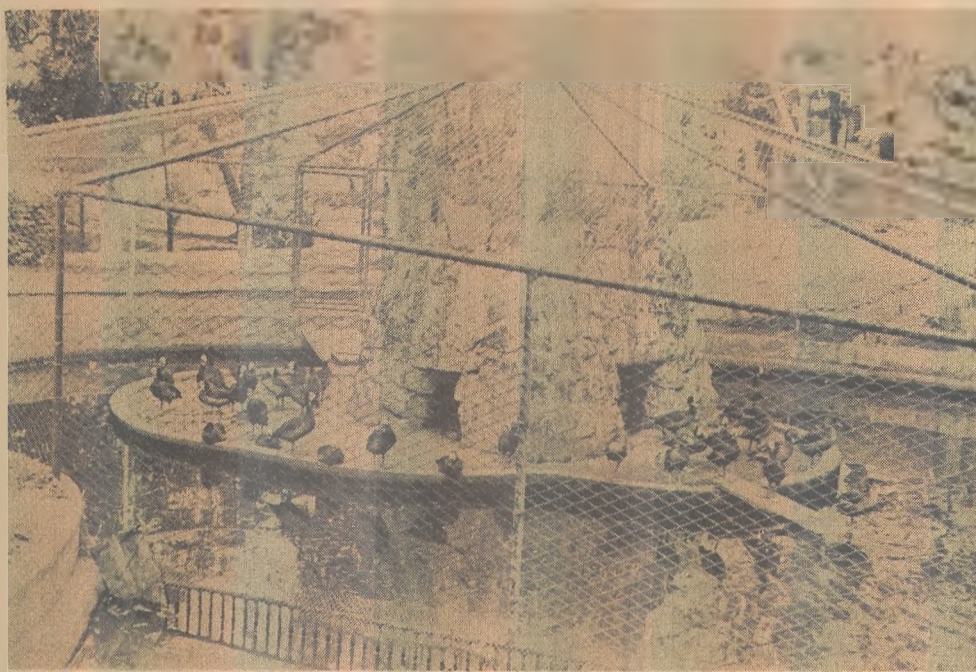
Parque Arruda Câmara oferece várias atrações aos pessoenses