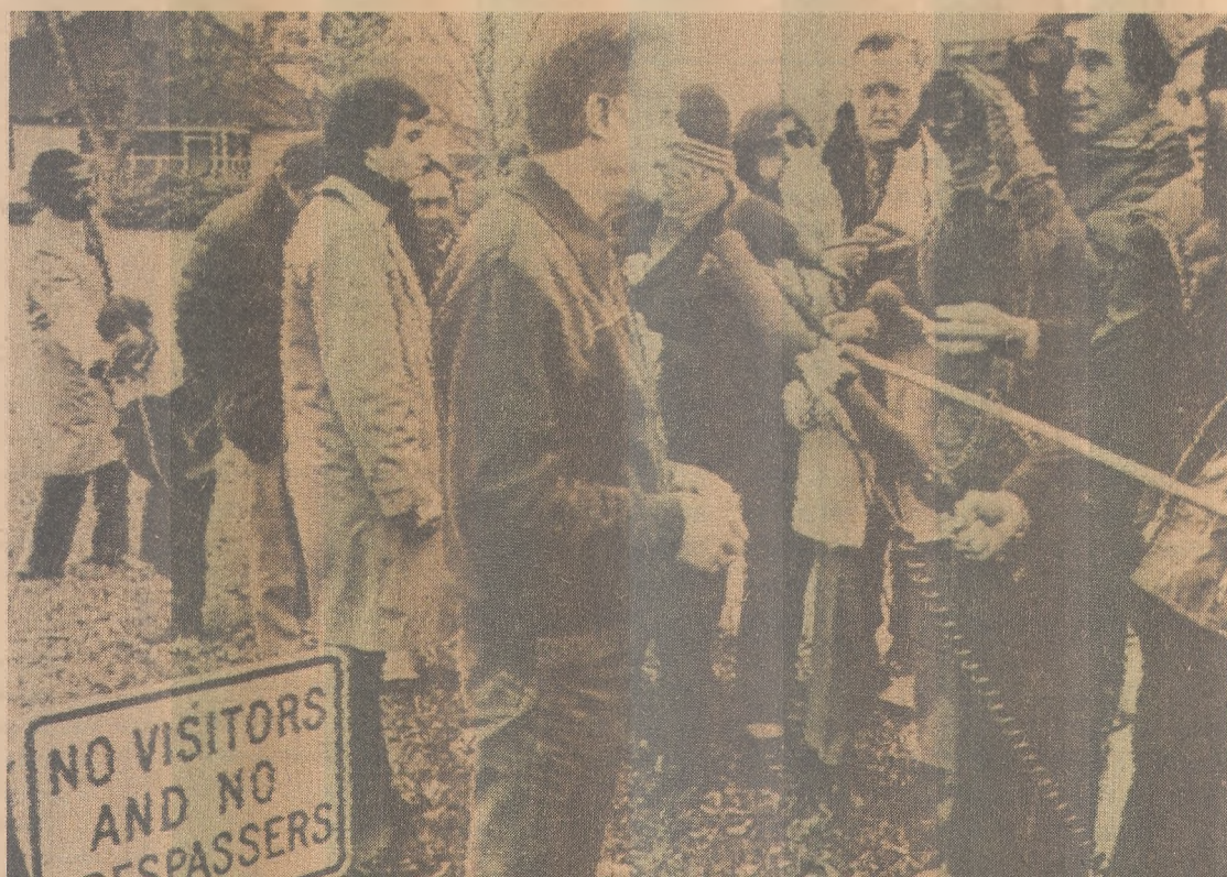
Carter assegura que os 52 reféns norte-americanos estão passando bem

Contudo, Carter não entrou em detalhes sobre como foi possível descobrir onde os 49 se encontram. O presidente disse esperar "um relatório mais completo" dos argelinos sobre a situação dos reféns.