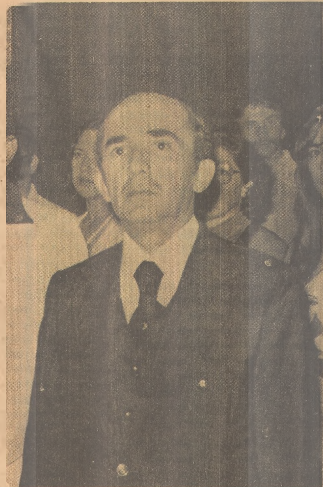
Vital: solidariedade dos vereadores