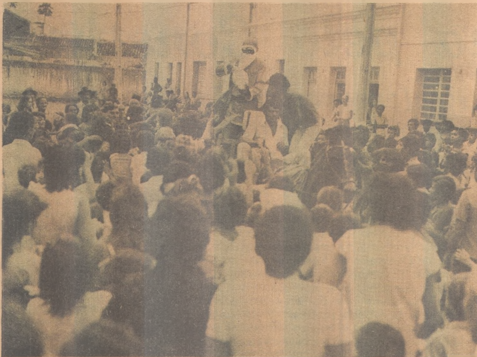
Crianças de Taperoá recebem brinquedos de Papai Noel