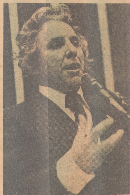
Deputado Agassiz Almeida