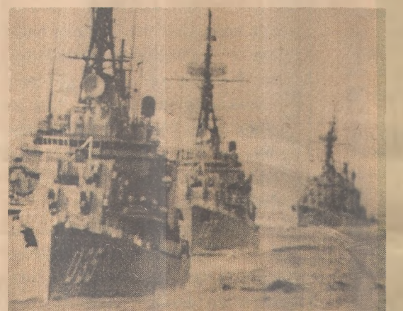
Navios da Esquadra Brasileira durante a Operação "Unitas" desenvolvida entre os portos de Fortaleza, Recife, Salvador e Rio de Janeiro, em agosto/80.

- AOS NOSSOS LEITORES: VOTOS DE UM PRÓSPERO E FELIZ ANO NOVO -