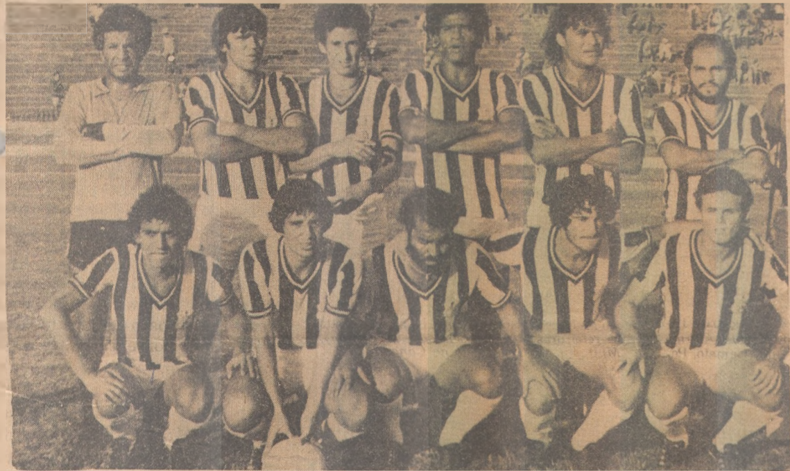
O Treze é um dos que não espera sucesso no Campeonato Brasileiro

No balanço geral, antecedendo a reapresentação dos jogadores, no dia dois de janeiro, quando serão iniciados os exames médicos e os primeiros treinamentos, os especialistas em futebol não acreditam que nossos representantes façam boa campanha na Copa Brasil.