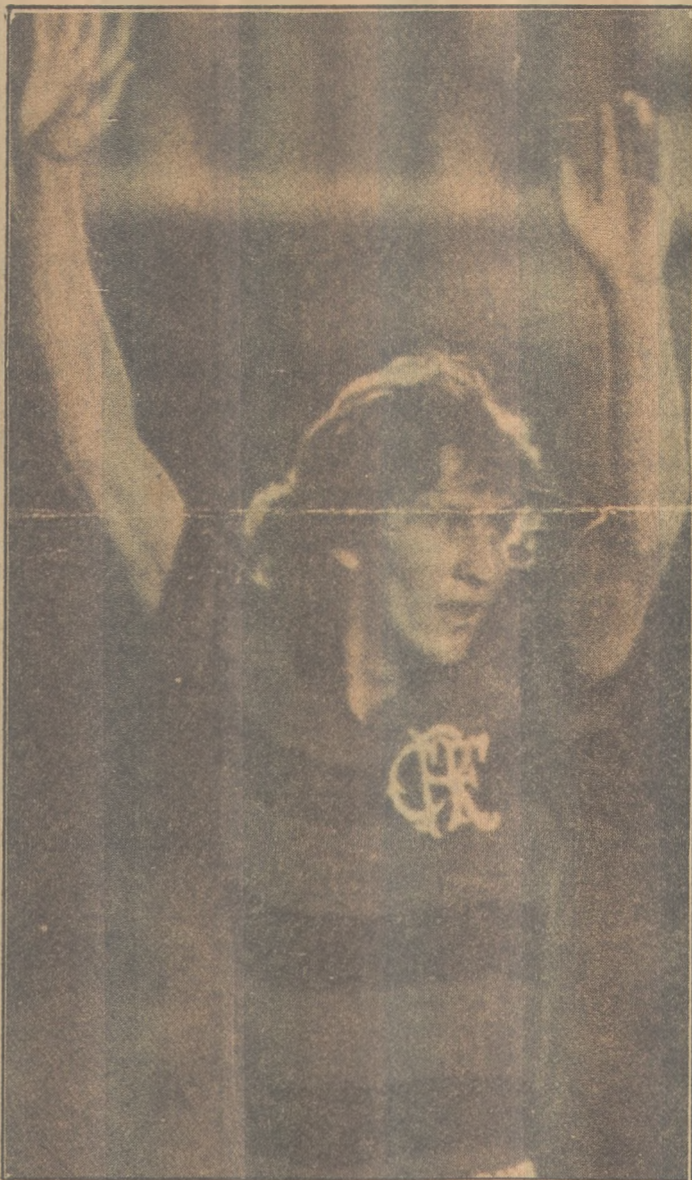
Zico é o grande desfalque no Mundialito

Em Santa Luzia o clima é de expectativa não apenas pelo jogo amistoso que será disputado, mas sobretudo pela solenidade de abertura da Semana Universitária, que contará com a presença de diversas autoridades.