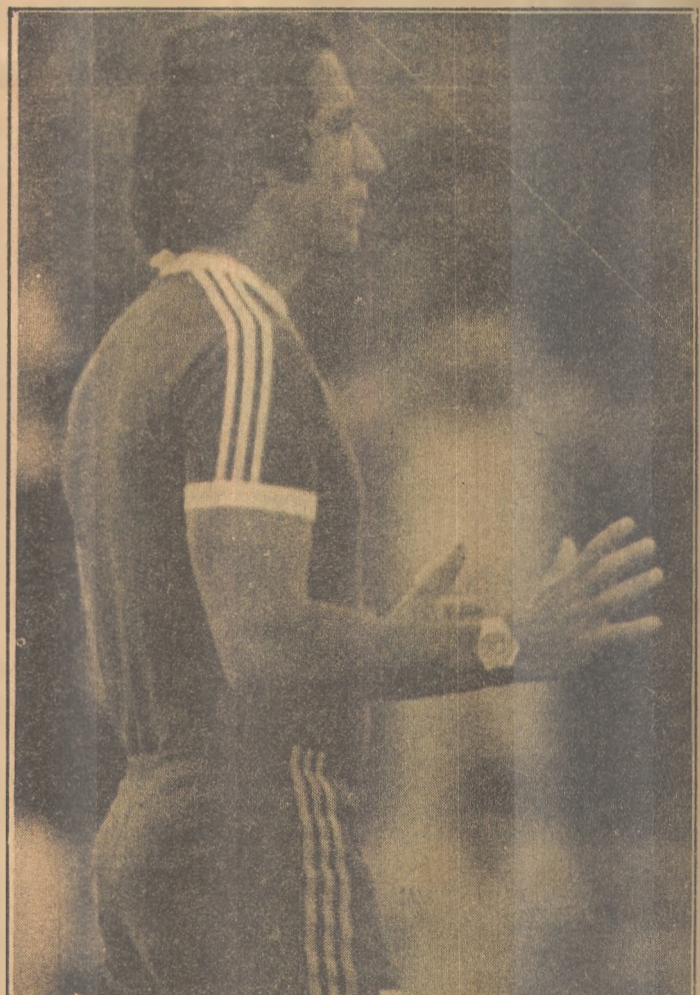
Coutinho não quis permanecer no Flamengo

O técnico Telê Santana tem apenas uma dúvida no time do Brasil para o jogo de estreia: Carlos ou João Leite, no gol. O resto da equipe está certa, salvo se houver outros problemas de contusão: Edevaldo, Oscar, Luizinho e Júnior; Batista, Cerezo e Renato; Tita, Sócrates e Zé Sérgio.